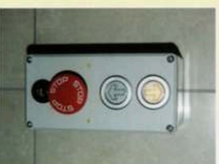
Rufstation mit Schlüsselschalter