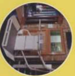
Rollstuhl-Schrägaufzüge für Treppen mit Kurven