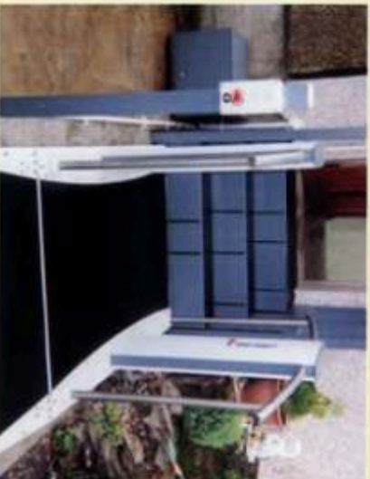
Lift in abgesenkter Position - Elemente bilden normale Treppenelemente

Der Lift kann wie abgebildet mit Elementen zur Überbrückung von bis zu 4 Treppenelementen ausgerüstet werden.