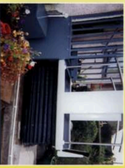
Lift in angehobener Position - Elemente bilden eine Brücke

Die Elemente bilden eine Brücke und ermöglichen so den Zugang mit Rollstuhl