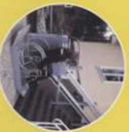
Rollstuhl-Schrägaufzüge für gerade Treppen