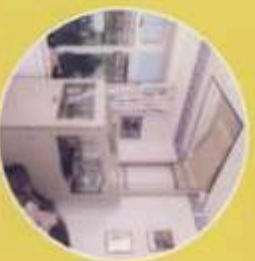
Rollstuhl-Senkrechtaufzüge geschlossene Kabine